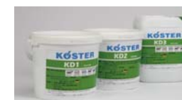
KD システム (左から) KD1, KD2, KD3