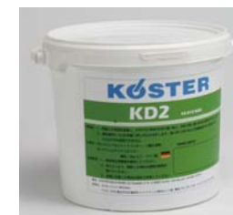
KD2 6kg 缶入り