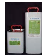
KP2 (8kg セット)