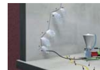
激しい漏水のある場合