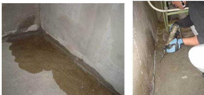
切付からの漏水に効果的です

溶剤、フィラー、可塑剤などの添加物を含まず、樹脂自体の化学反応で硬化する樹脂のこと。疎水性で収縮しないため水密性が高く、クラック注入に最も適しています。