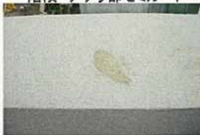
屋上・膨れ部 充填後