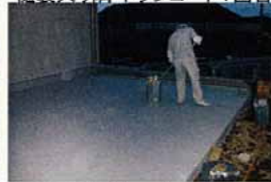
テラス平面・トップコート2回目