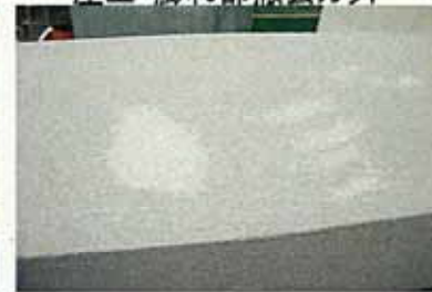
屋上・膨れ部 タッチアップ