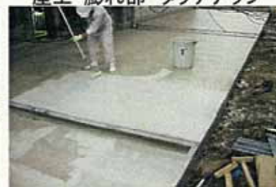
テラス平面・セミガード2回目