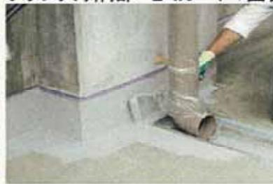
樋裏入り隅・トップコート1回目