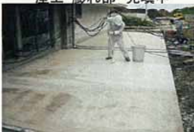
テラス平面・セミガード1回目