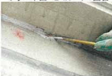
外壁取り合い細部・セミガード