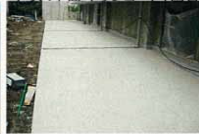
テラス平面・仕上げ状態