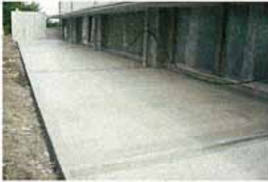
プライマー塗布後