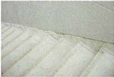
階段・ササラ部プライマー