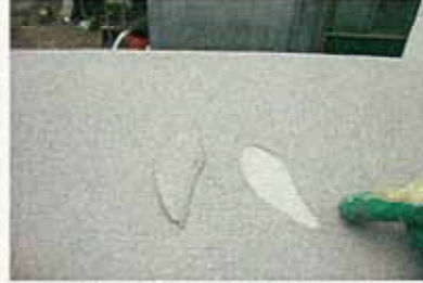
屋上・膨れ部撤去カット