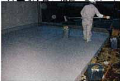
テラス平面・トップコート2回目