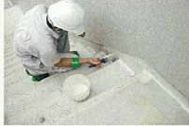
階段・ササラ部セミガード