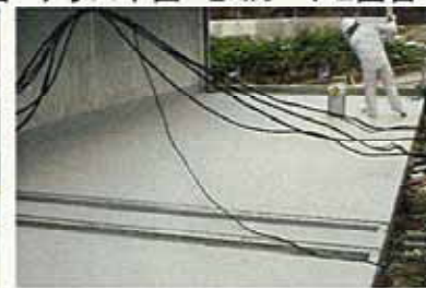
テラス平面・トップコート1回目