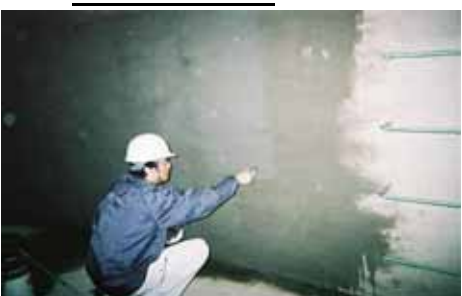
NB1 2層目 塗布