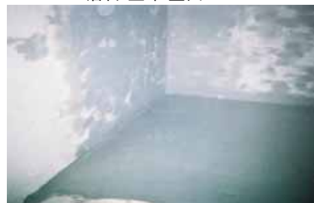
NB1 1層目 塗布 床面