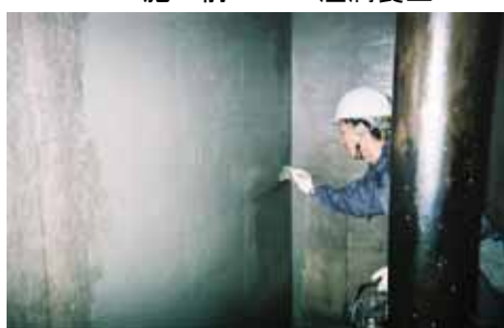
NB1 1層目 塗布 壁面