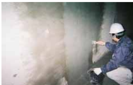
NB1 2層目 塗布