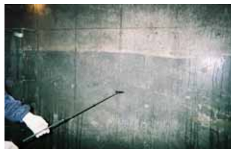
NB1 施工前 湿潤養生