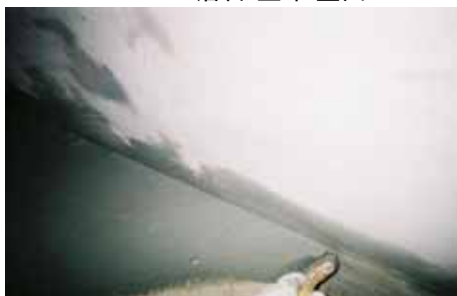
NB1 1層目 塗布 床面