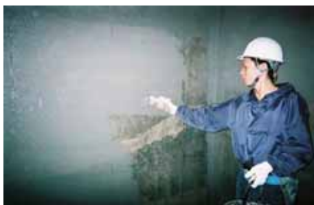
NB1 1層目 塗布 壁面