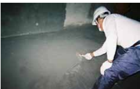
NB1 2層目 塗布