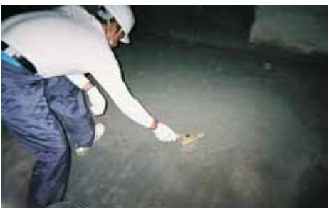
NB1 2層目 塗布