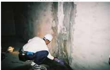
止水後 壁面からの漏水