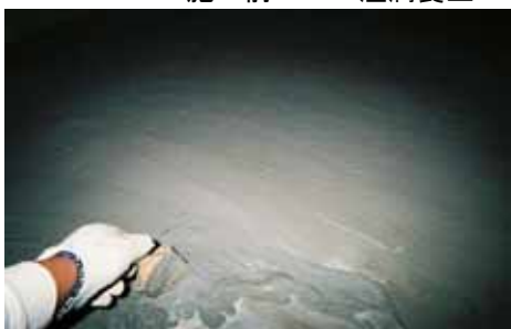
NB1 1層目 塗布 床面