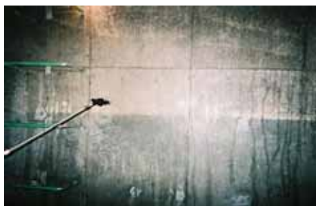
NB1 施工前 湿潤養生