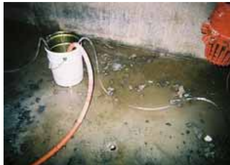
床 湧水部 現状