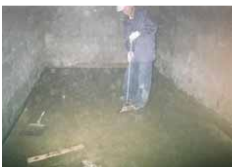
床 ケレン清掃 1