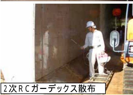
2次RCガーデックス散布