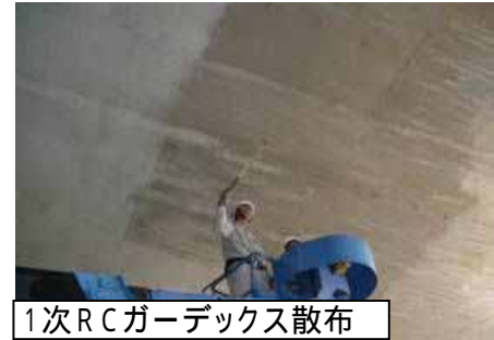
1次RCガーデックス散布