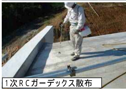
1次RCガーデックス散布