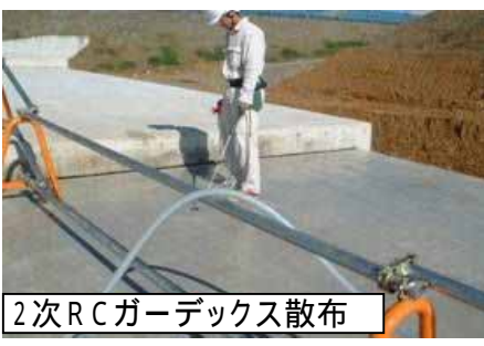
2次RCガーデックス散布