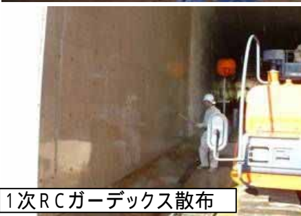
1次RCガーデックス散布