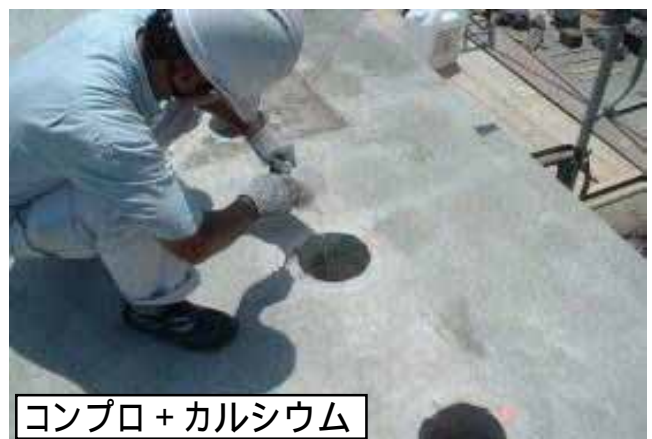
コンプロ+カルシウム